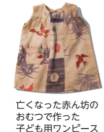
亡くなった赤ん坊のおむつで作った子ども用ワンピース

引揚げ時に発行された書類や、引揚船の模型、子どもたちの様子を撮影した写真などを展示しています。