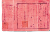
臨時召集令状(赤紙)