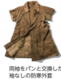
両袖をパンと交換した袖なしの防寒外套

ラーゲリ(収容所)の模型や、強制労働で使った道具、手作りの食器、体験者が描いた絵画などを展示しています。